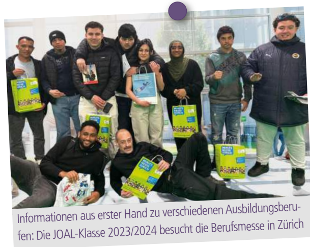
Informationen aus erster Hand zu verschiedenen Ausbildungsberufen: Die JOAL-Klasse 2023/2024 besucht die Berufsmesse in Zürich