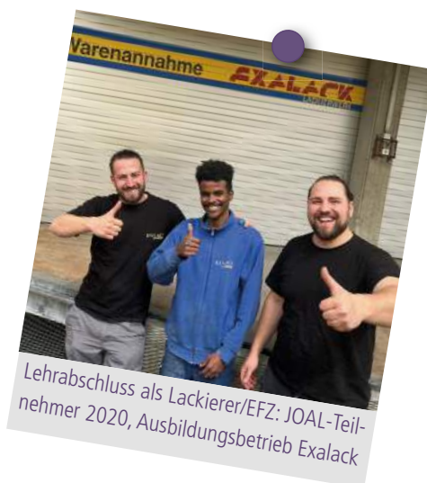
Lehrabschluss als Lackierer/EFZ: JOAL-Teilnehmer 2020, Ausbildungsbetrieb Exalack