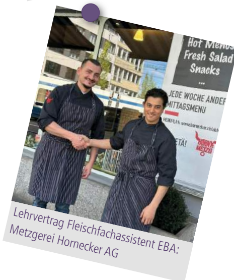
Lehrvertrag Fleischfachassistent EBA: Metzgerei Hornecker AG