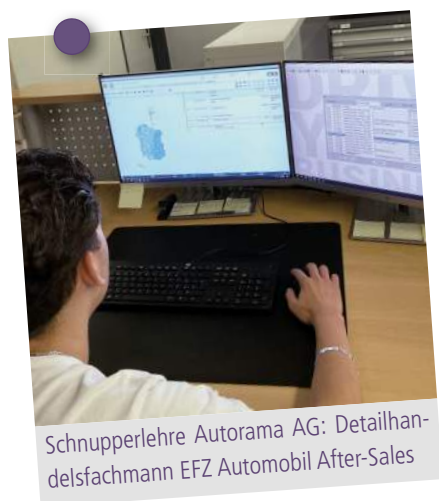
Schnupperlehre Autorama AG: Detailhandelsfachmann EFZ Automobil After-Sales