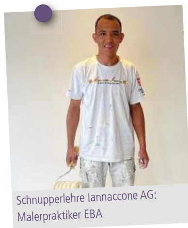
Schnupperlehre Iannaccone AG: Malerpraktiker EBA