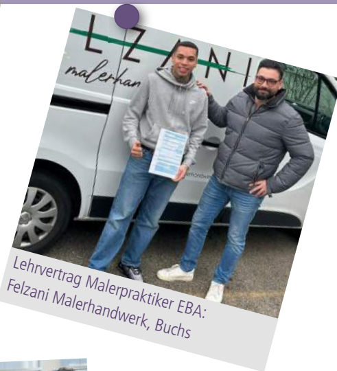
Lehrvertrag Malerpraktiker EBA: Felzani Malerhandwerk, Buchs