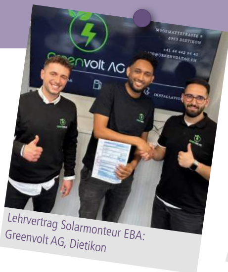
Lehrvertrag Solarmonteure EBA: Greenvolt AG, Dietikon