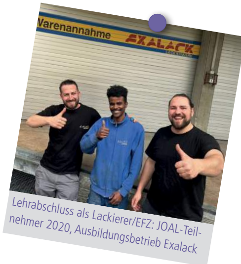
Lehrabschluss als Lackierer/EFZ: JOAL-Teilnehmer 2020, Ausbildungsbetrieb Exalack