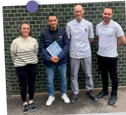
Lehrvertrag Bäcker-Conditor-Confiseur EBA: Stiftung St. Jakob, Zürich