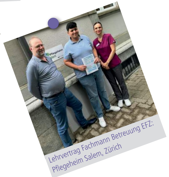
Lehrvertrag Fachmann Betreuung EFZ: Pflegeheim Salem, Zürich