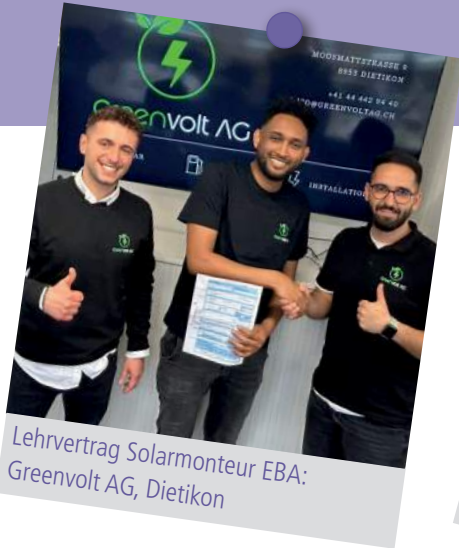
Lehrvertrag Solarmonteure EBA: Greenvolt AG, Dietikon