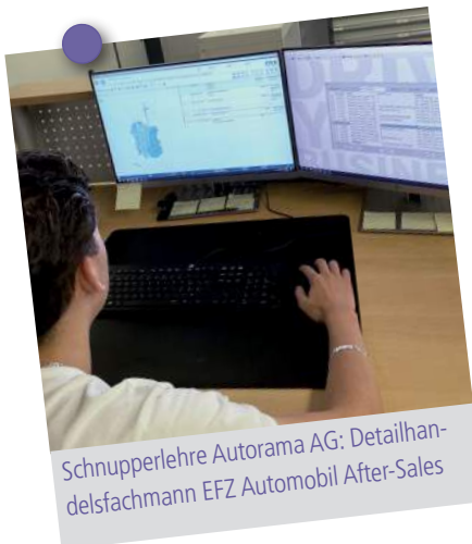
Schnupperlehre Autorama AG: Detailhandelsfachmann EFZ Automobil After-Sales