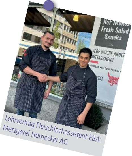
Lehrvertrag Fleischfachassistent EBA: Metzgerei Hornecker AG