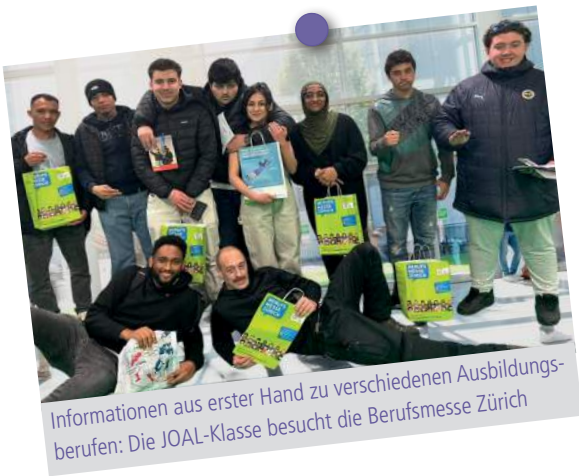
Informationen aus erster Hand zu verschiedenen Ausbildungsberufen: Die JOAL-Klasse besucht die Berufsmesse Zürich