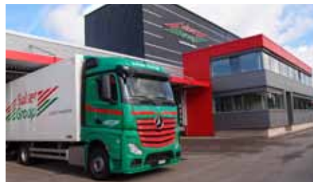
Sulser Logistics Solutions AG / Sulser Transport AG , Logistikcenter Brunegg Breitackerstrasse 10 CH-5505 Brunegg / AG Telefon 0844 40 20 40, info@sulsergroup.ch