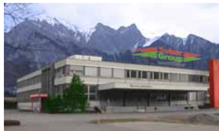
Swiss Logistics Academy AG Ausbildungszentrum Elestastrasse 18 CH-7310 Bad Ragaz / SG Telefon 071 277 40 00 / Fax 044 847 46 88 kursadministration@sulsergroup.ch